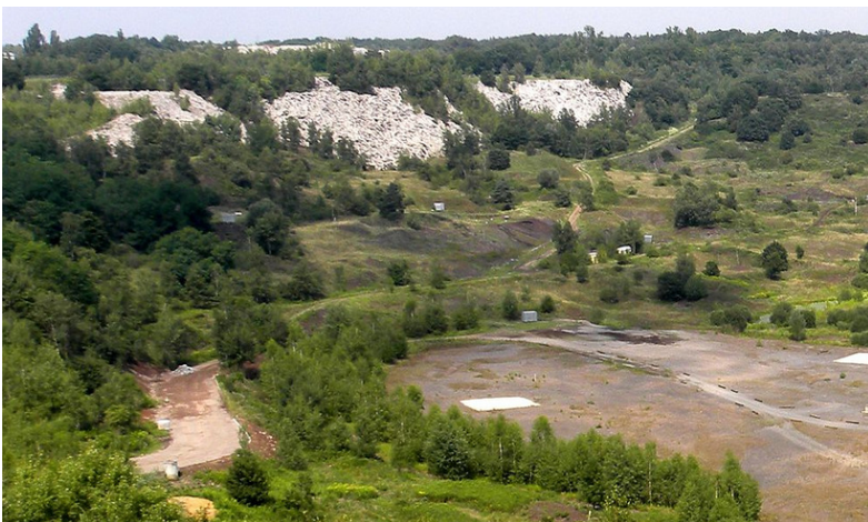
Blick in die Grube Messel (public domain)