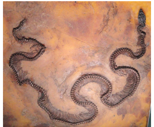
Palaeopython fischeri , CCO nach Joschka Fischer benannt

In der Grube wurde zunächst Erz gewonnen und vom 19. Jahrhundert bis ca. 1970 Ölschiefer abgebaut. Anschließend sollte sie zur Mülldeponie werden. Erst nach langjährigen politischen und juristischen Auseinandersetzungen konnte dieses einmalige Archiv der Evolution gerettet werden. 1995 wurde sie zum UNESCO-Weltnaturerbe erklärt.