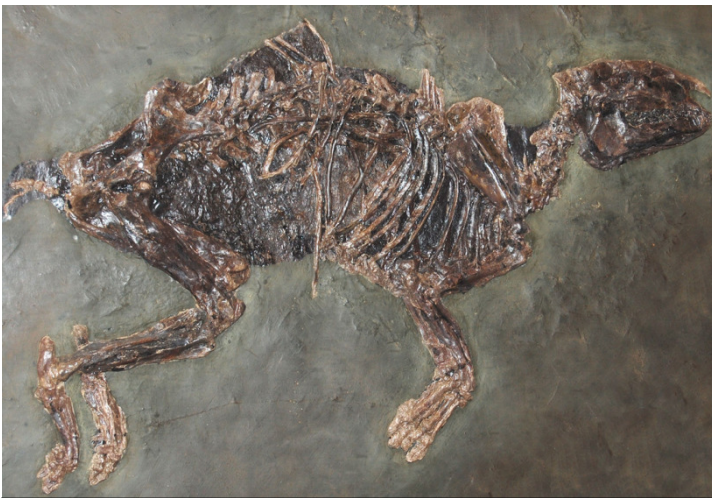
Urpferdchen (Propalaeotherium) CC BY 2.0

Wir starten um 9:00 Uhr am Bahnhof Durlach und fahren mit modernem Reisebus ins nord-östlich von Darmstadt gelegene Messel.